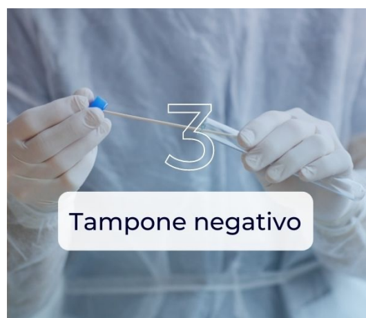
3 Tampone negativo

TAMPONE NEGATIVO: è necessario esibire il risultato negativo di un tampone molecolare o antigenico rapido che verrà attestato dalla farmacia o dal laboratorio di analisi presso cui è stato eseguito il tampone ed ha valore di 48 ore dall'esecuzione del test.